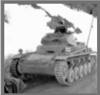
TANKS: Lett tysk panservogn på veien mellom Dombås og Trondheim i 1940, sør for Berkåk.