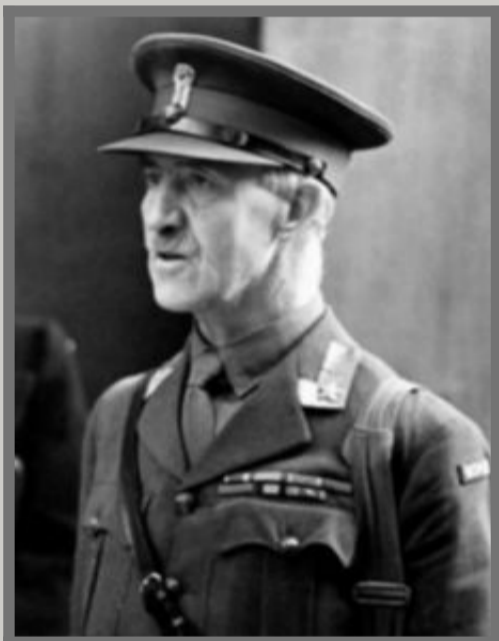
HELTEN: Skal du vinne i brettspillet «Kampen om Norge», må du blant annet gjenskape øverstkommanderende for de norske styrkene i Nord-Norge, generalmajor Carl Gustav Fleischer seier over de tyske styrker ved Narvik.